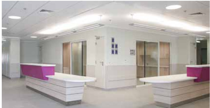
פרויקט בית החולים הרצוג ירושלים - הראשון מסוגו בארץ הנבנה תוך עמידה בתקן הירוק. אדריכלות: עופר קפלינסקי, ביצוע: ינושבסקי א. הנדסה ובניין

חדשנות, קרקע, בריאות ורוחה. השפעה זו הינה למשל שימוש בחומרים ממוחזרים ובעלי תו תקן ירוק, מחזור פסולת הבנייה, סילוק פסולת עפר ועוד. סך השפעת קבלן הביצוע מוערך בכ-15%-20% מסך הנקודות בתקן למבני מגורים. חשוב גם לזכור כי על פי רוב לא מגיעים ל-100 הנקודות האפשריות ולכן השפעת הקבלן אף עולה. על מנת לשלב את קבלני הביצוע בצורה נכונה בתפיסת הקיימות יש להפוך את הקיימות לשיקול בקבלת החלטות ביצועיות , בדומה לאיכות, בטיחות, מחיר, לוי"ז וכו'. כדי ליצור שינוי כזה נדרש לנקוט בשיטות להטמעת חשיבות התקן והשפעתו, ואלה הן: