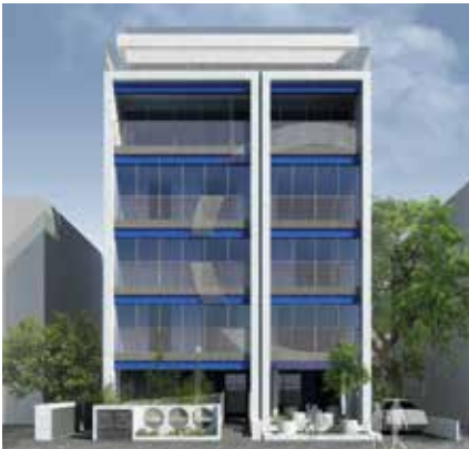
הדמיה, פרויקט תמ"א 38/1, רח' יהושע בן נון, תל אביב - בנייה ירוקה. אתגר נול אדריכלים, יזמות וביצוע: ינושבסקי ייזום ופיתוח