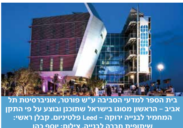
בית הספר למדעי הסביבה ע"ש פורטר, אוניברסיטת תל אביב - הראשון מסוגו בישראל שתוכנן ובוצע על פי התקן המחמיר לבנייה ירוקה - Leed פלטיניום. קבלן ראשי: שיתופית חברה לבנייה.

בשנים האחרונות נושא הבנייה הירוקה מוטמע כמעט בכל פרויקט ציבורי שחברת שיתופית לקחה על עצמה. הדרישות לעמידה בתקן הישראלי לבנייה ירוקה, ת"י 5281, כבר נמצאות בפרויקטים בשלב התכנון ועמידה בדרישות היא חלק מתנאי החוזה. כל פרויקט שונה